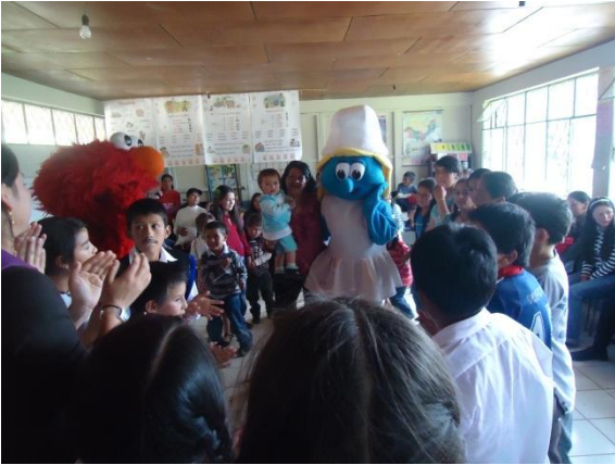
ESCUELA LUIS VARGAS TORRES