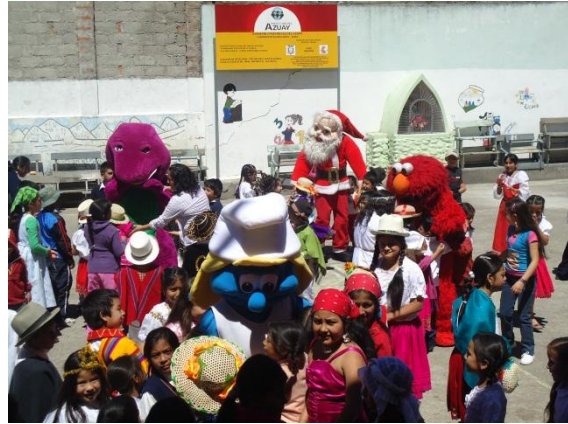
ESCUELA JOSE ANTONIO DIAZ