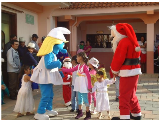
COMUNIDAD DE ANDACOCHA