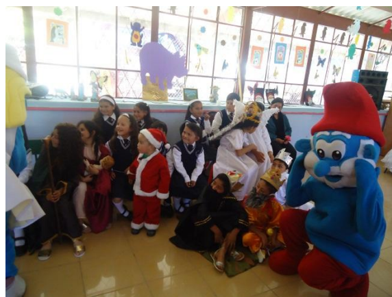
ESCUELA FELIPE SERRANO SACRE