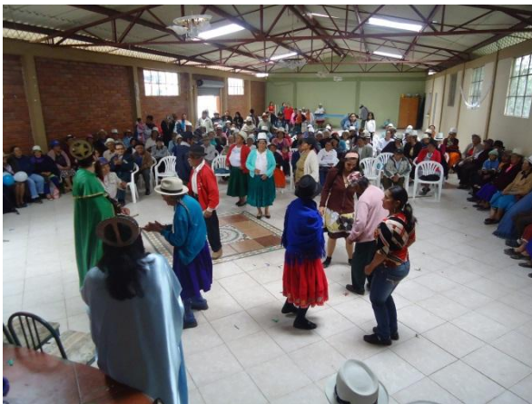
ADULTOS MAYORES SEÑOR DE GUACHAPALA