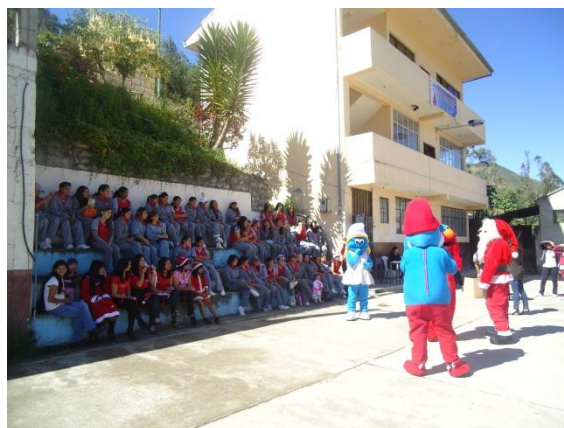
CENTRO ARTESANAL REINA DE LA NUBE